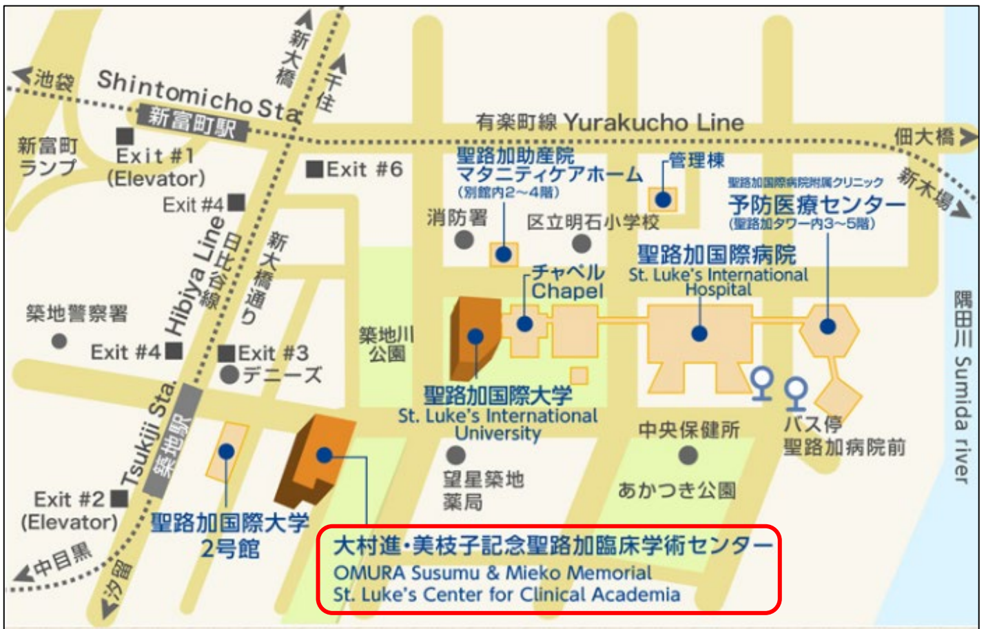
聖路加国際大学キャンパスマップ