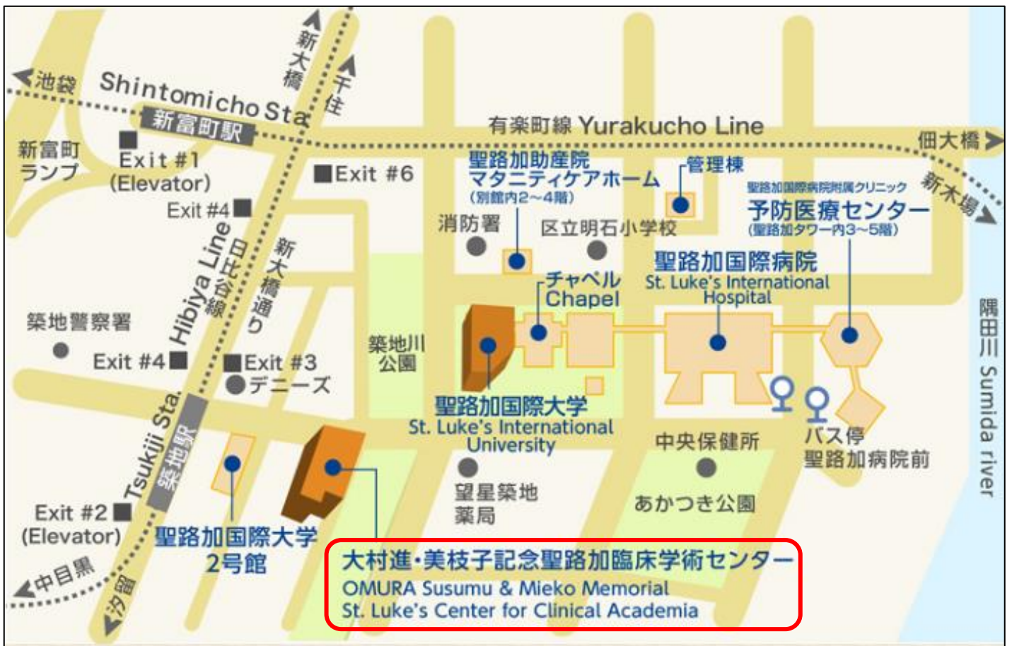
聖路加国際大学キャンパスマップ