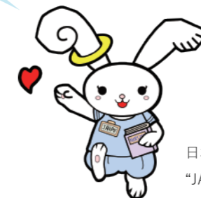
日本看護系大学協議会マスコットキャラクター “JANPUちゃん”